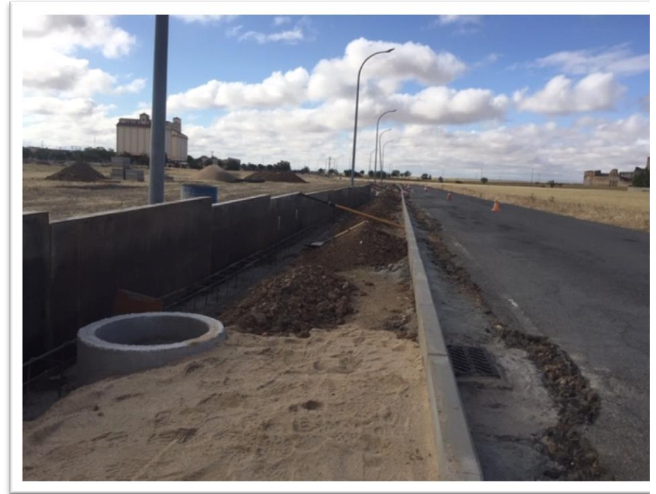
Imbornales sifónicos y pozos para recogida de aguas

MEMORIA OBRAS PASEO PEATONAL CAMINO DE LOS SILOS MADRIGAL DE LAS ALTAS TORRES, ÁVILA