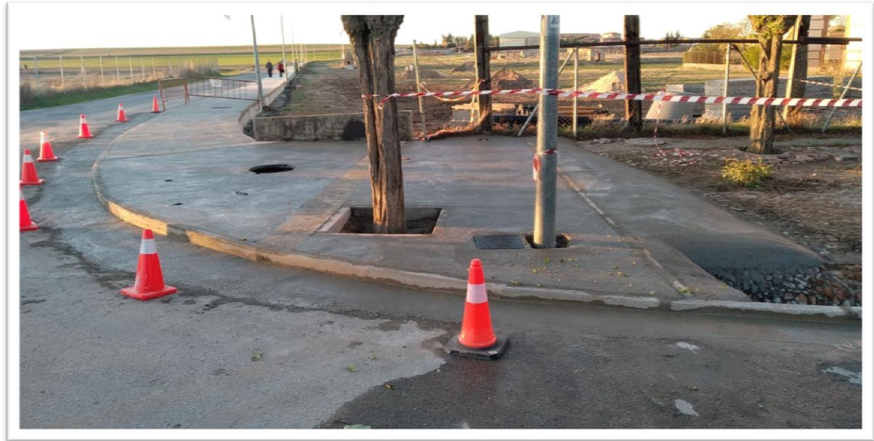
Solera de hormigón

MEMORIA OBRAS PASEO PEATONAL CAMINO DE LOS SILOS MADRIGAL DE LAS ALTAS TORRES, ÁVILA